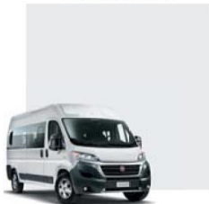
549 Bianco Ducato