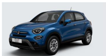
Забарвлення кузова фарбою металік синього кольору (код 018)

Виробник або продавець залишає за собою право зміни комплектацій та цін на автомобілі без попереднього повідомлення.